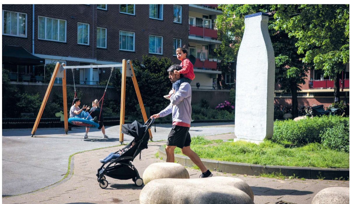
Hercules Seghersplein met de melkfles

De nieuwbouw kent een bijzonder verhaal dat begint met de kraak en bezetting van de melkfabriek. Hier werd zo'n beetje de kraakbeweging in De Pijp ge-