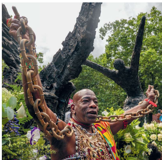
Keti Koti in het Oosterpark

Voor de volledige agenda, kijk op oba.nl/agenda .