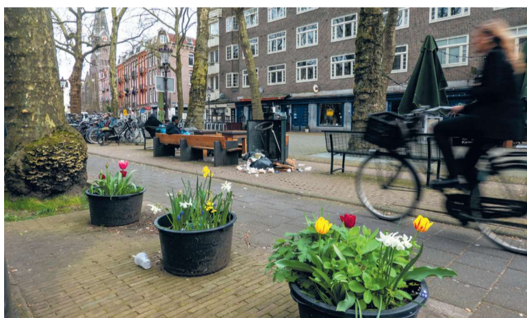
Bloembollen op het Van der Helstplein - Foto: Rob Godfried

Hiervoor werken zij samen met het Groen Gemaal, dat planten te geef en