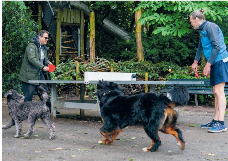
Hondse supporters - Foto: Rob Godfried

Soms komen er in één keer heel veel honden naar het hondenveld naast de ping-pongtafels. Dan is het ineens heel druk en