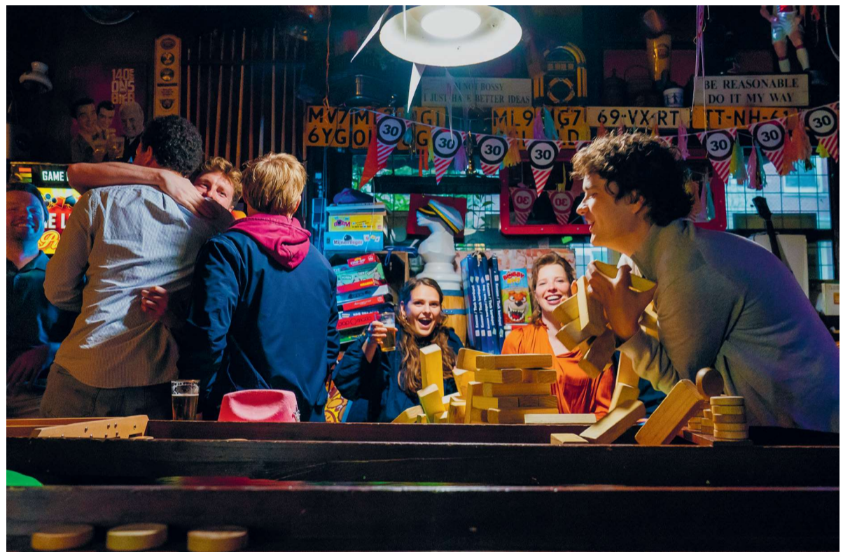
Jengapech